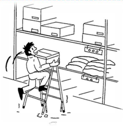
脚立がぐらつきバランスを崩した。