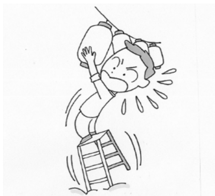
脚立がぐらつきバランスを崩した。